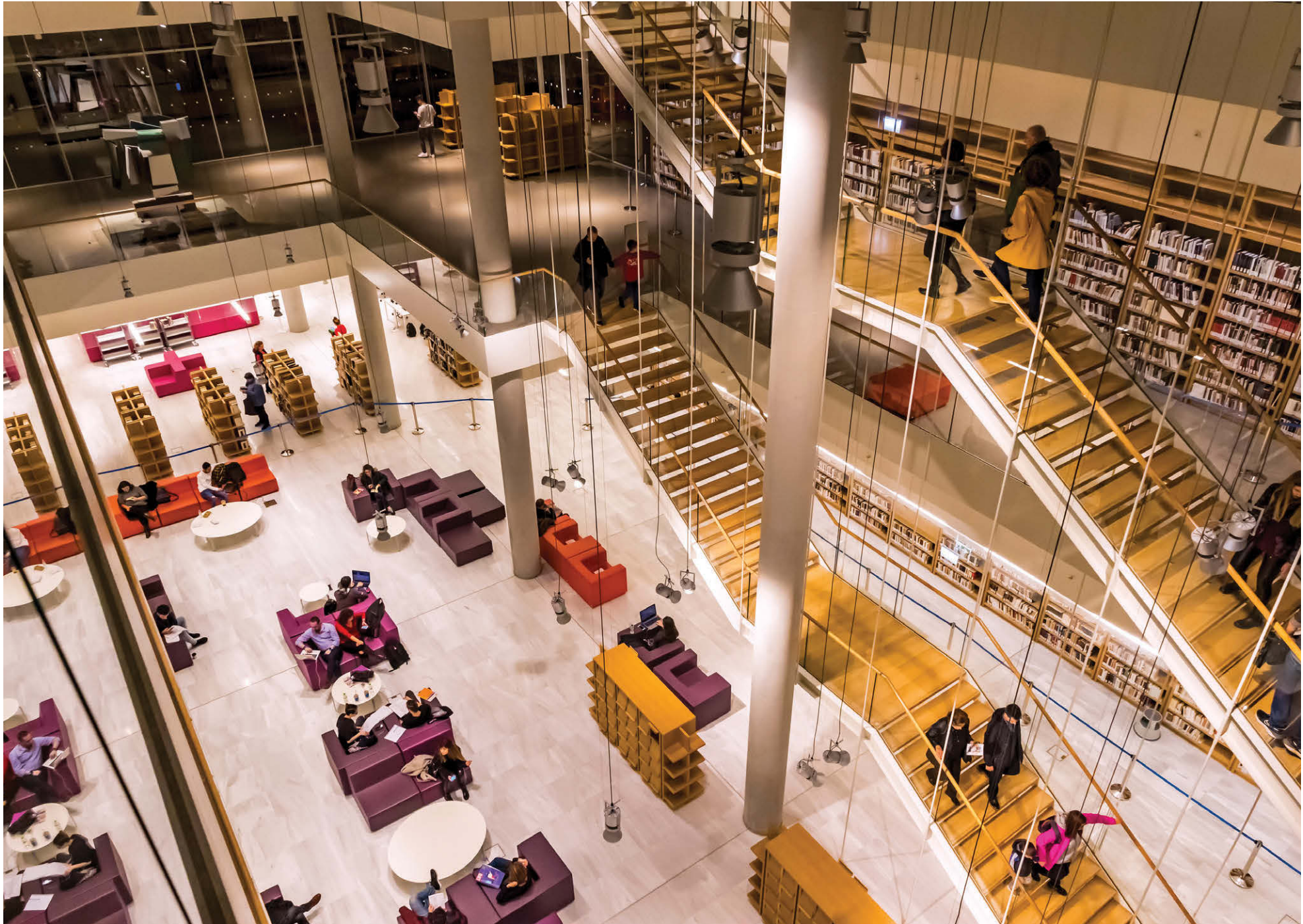
Η Εθνική Βιβλιοθήκη, ένα από τα σημαντικότερα πνευματικά ιδρύματα της χώρας, για πρώτη φορά στην ιστορία της διαθέτει εκδοτικό πρόγραμμα, όπως όλες οι μεγάλες βιβλιοθήκες του κόσμου.